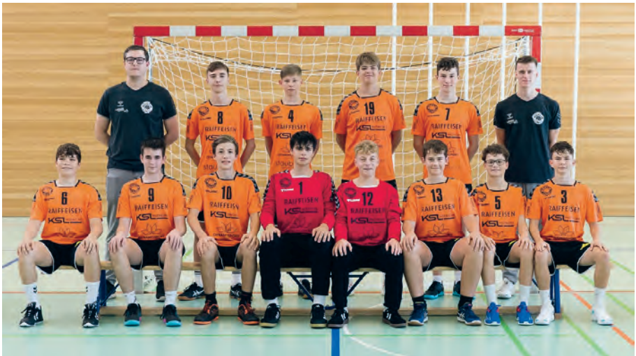
Foto: MU17 Inter SG Möhlin/Magden