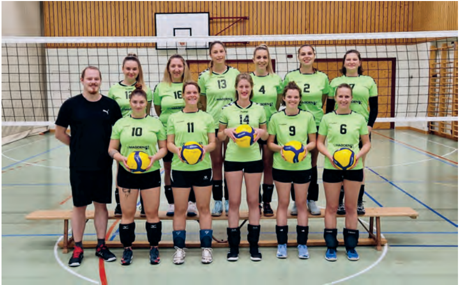
Foto: Volleyball Damen, Saison 2022/2023