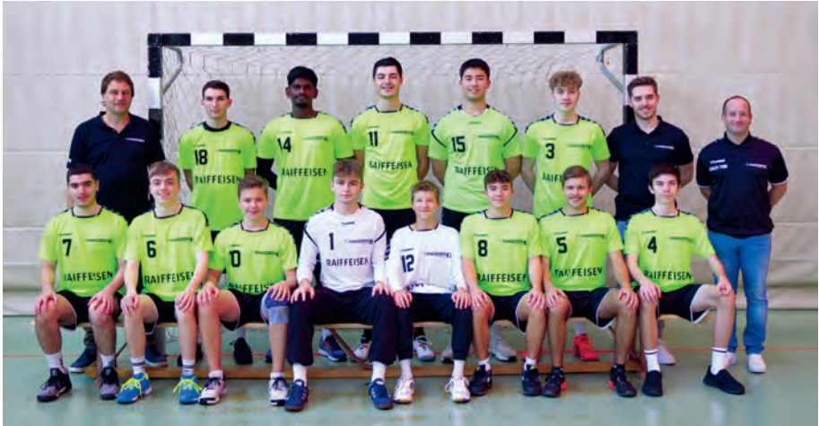
Foto: MU19 Promotion SG Magden/Möhlín, Saison 2022/2023

Die letzte Saison fing eher mäßig an. Wir waren alle noch nicht so eingespielt und mussten uns erst aufeinander abstimmen. Die Hinrunde wurde dann wegen Corona abgebrochen und wir durften nur noch trainieren. Diese Zeit haben wir dann sinnvoll genutzt und sind als Mannschaft zusammengewachsen. Als dann bekannt wurde, dass es eine Rückrunde geben wird, haben wir uns alle sehr gefreut. Diese startete auch mit einem Sieg. In der Rückrunde konnten wir auch unser Ziel erreichen und waren mit dem Ergebnis sehr zufrieden. Trotz des Erreichens unserer Ziele streben wir nach noch erfolgreicherer Saisons, die wir mit der Mannschaft feiern können.