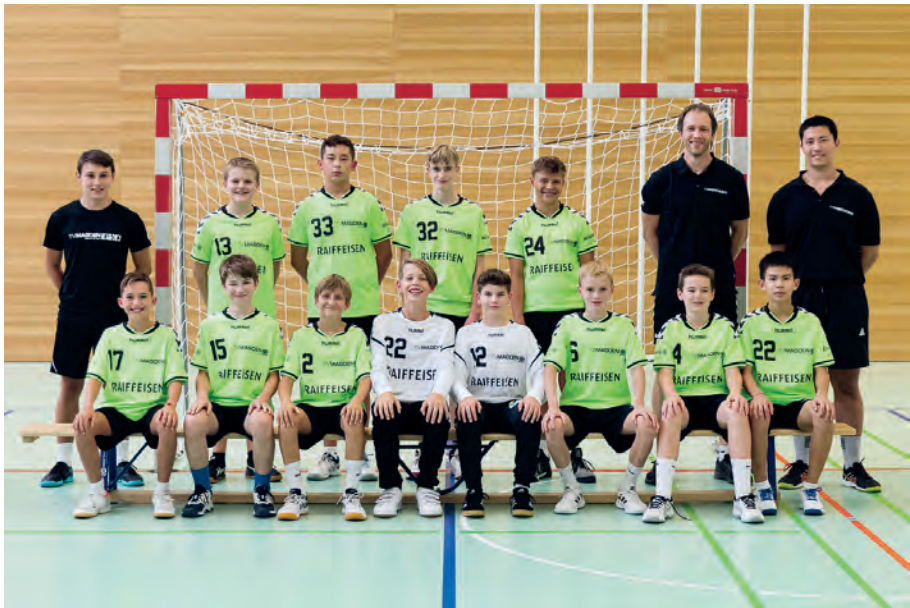
Foto: MU15 Promotion SG Magden/Möhlin Saison 2022/2023

Diese Saison konnten wir, wenn auch knapp, eine MU15 Regio Mannschaft stellen. Was letztes Jahr aufgrund fehlender Junioren leider nicht geklappt hatte. Das war allerdings nur möglich, weil wir aus 2 Mannschaften (Möhlin Inter und Magden Regio) ein Spielergefäß gebildet haben. Das heisst, dass Spieler, welche im Inter nicht viel Spielpraxis an den Spielen bekommen, die Regio verstärken. So können sie dort Spielerfahrungen sammeln und im Gegenzug die Regio Spieler die zusätzlichen Trainings im Inter besuchen und sogar mal im Inter mitspielen könnten.