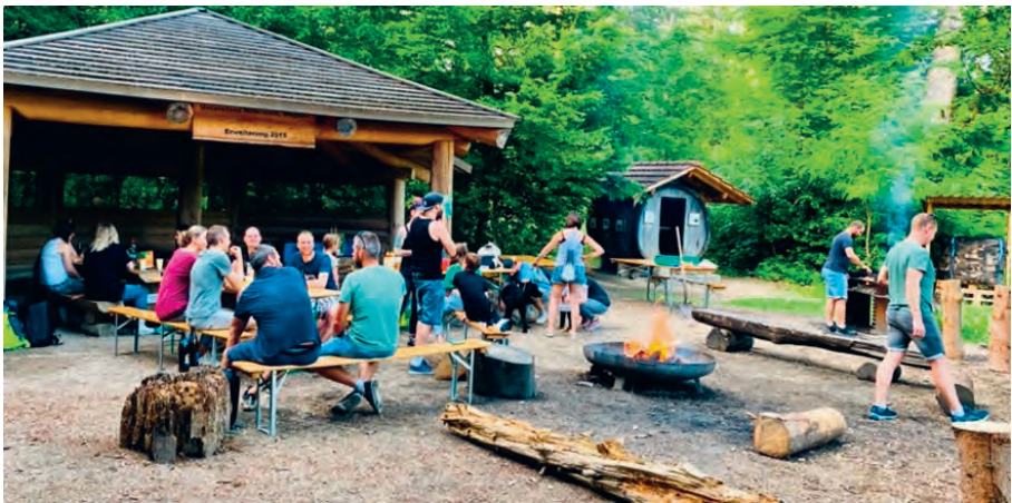
Foto: Saisonabschluss 2022

Das erste Spiel konnten wir noch klar gewinnen, doch leider verloren wir die nächsten 3 Spiele wieder deutlich. Nach einem Tief kam dann auch wieder ein Sieg am 11.12. um 10:15 Uhr am Morgen. Es wurde schon spekuliert, ob dies wohl «unsere» Spielzeit ist. Doch leider kam die Realität schneller zurück als man dachte. Die nächsten 5 Spiele gingen wir wieder leer aus. Somit mussten wir am Schluss noch fast um den Abstieg bangen. Doch wir haben uns wieder gefangen und konnten den Ligaerhalt mit eigener Kraft sichern. Natürlich spielt das gesellige Beisammensein im Herren 2 auch immer eine Rolle und so feierten wir unseren Saisonabschluss gemütlich mit unseren Familien und Freunden im Wald.