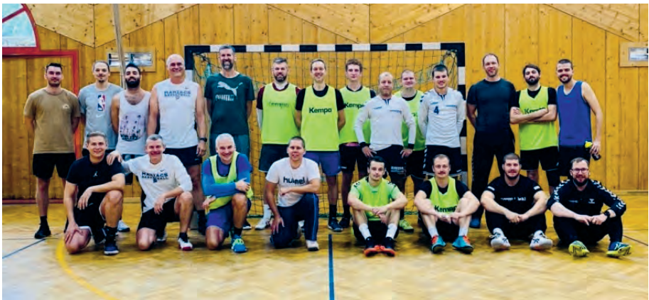
Foto: Gruppenfoto Handball & Basketball aus dem Trainingslager Sölden 2022

Verfasser: Philipp Stalder, Trainer TV Magden 2