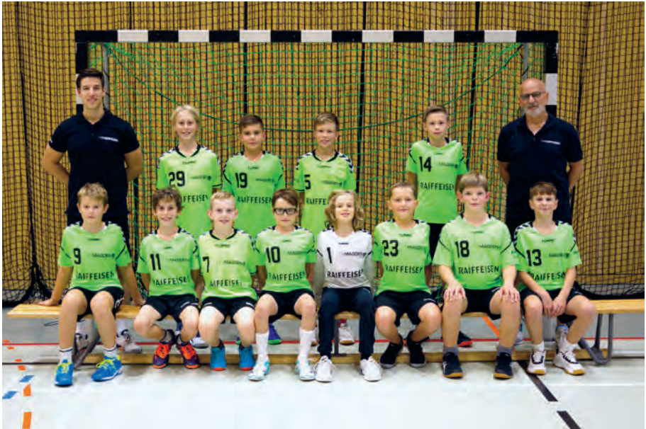
Foto: U13 SG Magden/Möhlin, Saison 2022/2023