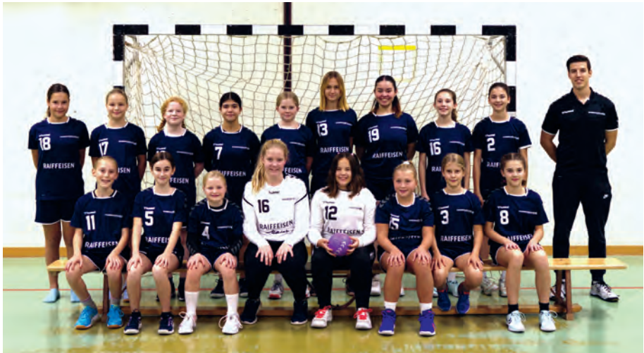
Foto: FU14 Promotion SG Magden/Möhlin, Saison 2022/2023

Die Saison von 2021/2022 wurde von der FU14 der SG Magden/Möhlin auf dem 4. Rang abgeschlossen. Das Team konnte einige Erfolge feiern, wozu nicht nur ein paar Siege gehören, sondern auch die handballerische Entwicklung jeder einzelnen Spielerin. Den Trainer:innen war und ist besonders die Entwicklung der Spielerinnen wichtig. Es ist schön zu sehen, wie einige Spielerinnen in der Saison 2021/2022 neu zum Team gestossen sind, zu Beginn noch wenig Spielzeit hatten und mittlerweile sich mit ihrem handballerischen Können in die Startaufstellung hinaufgearbeitet haben.