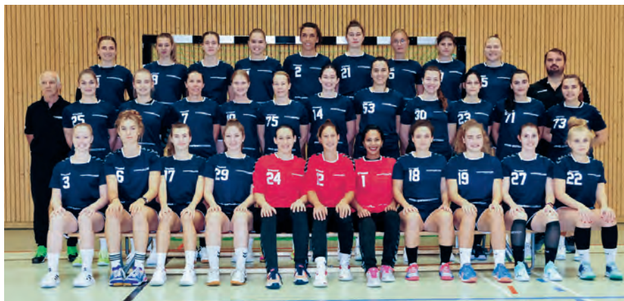
Damen 1 & 2, Saison 2022/2023

Bis Ende Jahr stehen noch folgende Heimspiele an: